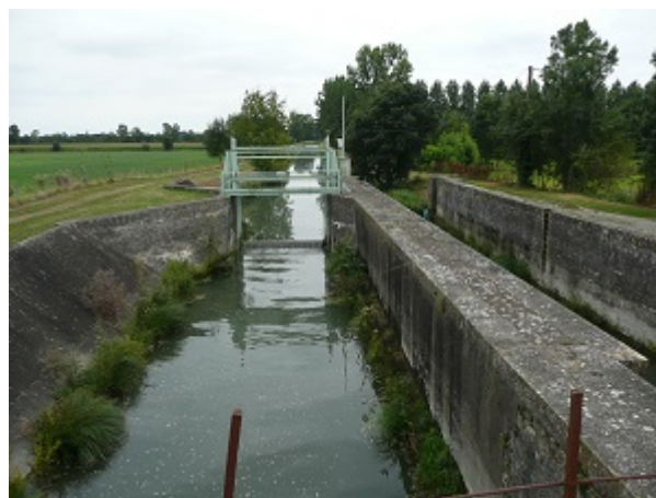
Canal du Mignon

2. À gauche, par l'itinéraire utilisé à l'aller, retrouver la mairie.